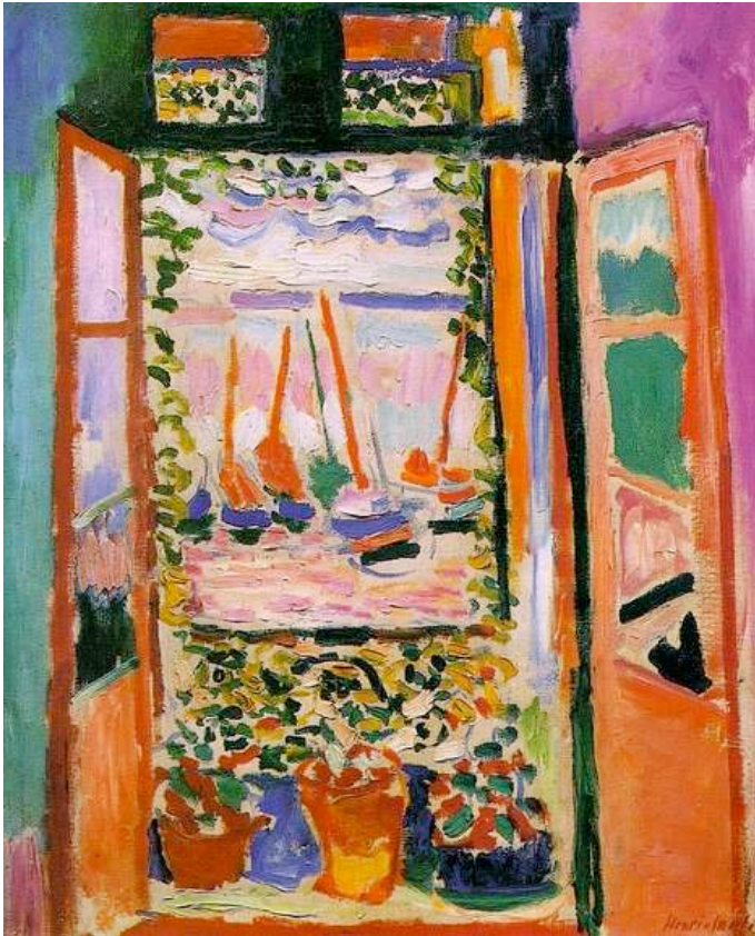
Matisse. Fenêtre ouverte à Collioure, 1905

A l'image des fauvistes, peins toi aussi un paysage avec des couleurs inhabituelles.