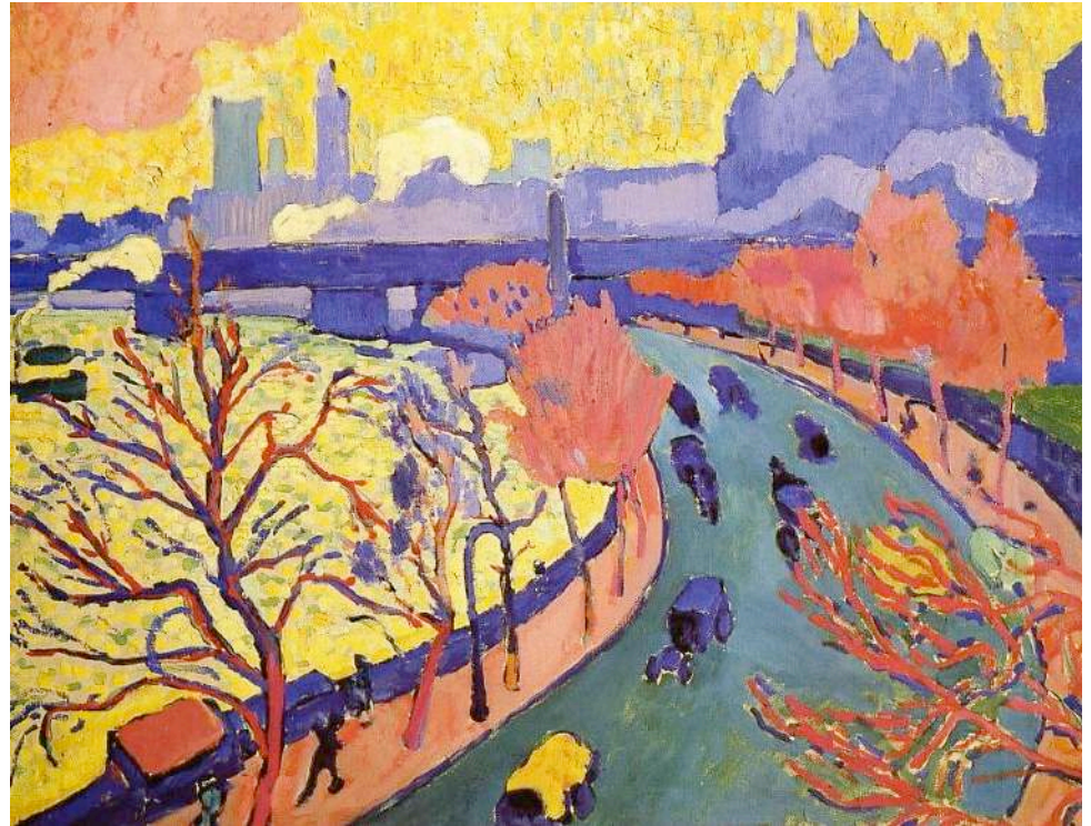
Derain. Pont de Charing Cross à Londres, 1906